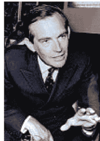
Sudafricano, Christiaan Barnard (1922-2001), è stato il primo chirurgo a effettuare un trapianto di cuore