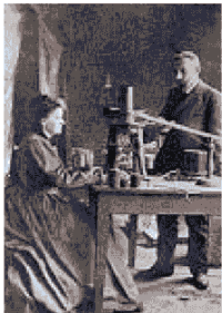
Polacca, naturalizzata francese, Marie Curie (1867-1934), è stata la prima donna a vincere due Nobel per la scienza